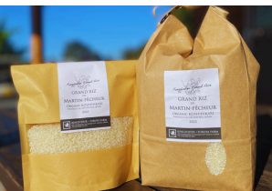
ルカの美味しいお米