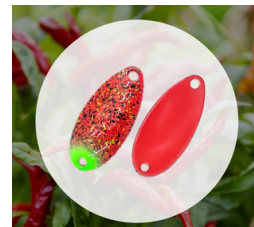
唐辛子をモチーフにしたルアー