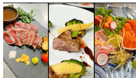
左から、那須野ヶ原牛たたき、マ グロ類肉のグリル、お刺身